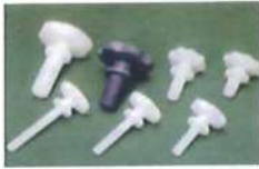
● 梅花螺絲(PP/PVC) * 英制粗牙(W)