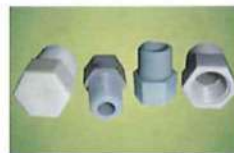
● 外牙平面塞頭、卜伸(一邊外牙)(一邊內牙)(PP/PVC)