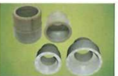
● 外牙閥接頭(對接/套接)/濾管用大異內徑內牙(對接)(PP)