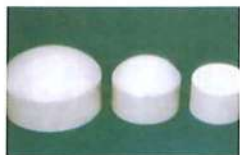
● 管帽(塞口套接) (PP)