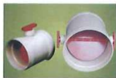
● 手動風門開關(套接) (PP)