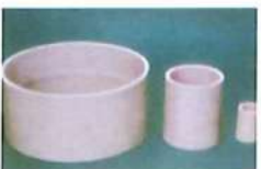
● 同徑接頭(平接頭套接) (PP)