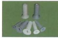
● 皿字型十字(皆全牙)(PP/PVC) * 公制粗牙(M)