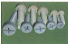
● 圓頭十字(皆全牙)(PP/PVC) * 公制粗牙(M)