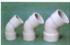
● 45° 彎頭(風口) (PP)