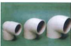
● 90° 彎頭(套接) (PP)