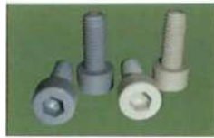
● 圓頭內六角(PP/PVC) * 公制粗牙(M)