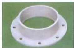
● 焊接抽風法蘭(套接) (PP)