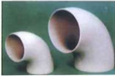
● 90° 大月彎(對接) (PP)