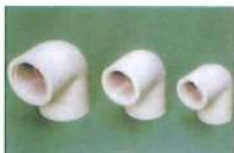
● 內牙彎頭(套接) (PP)