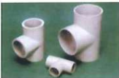
● 三通(套接) (PP)