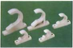
● 45° 固定座(PP/PVC)