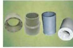
● 內牙接頭(套接) (PP/PVC)