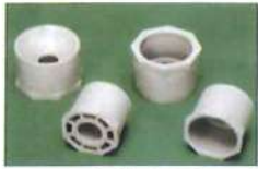
● 大小直接頭(短型)外徑(對接)內徑(套接)(PP)