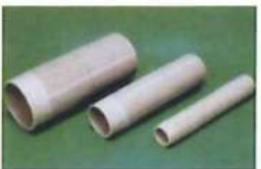
● 水壘加長型(濾管外牙)(PP)