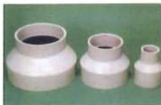
● 大小直接頭(短型)外徑(對接)內徑(套接)(PP)